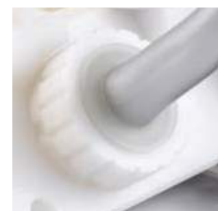
Adattatore per manipoli micromotore Permette di trattare i manipoli micromotore