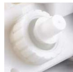
Tappo Necessario per chiudere gli attacchi che non vengono utilizzati