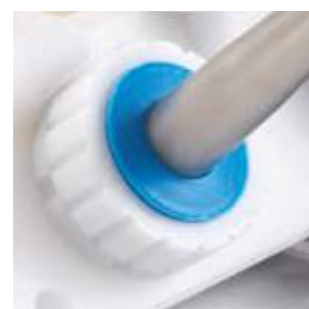
Adattatore per turbina Permette di trattare le turbine