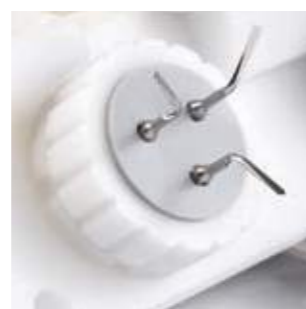
Adattatore per punte del detartatore Permette di trattare fino a 3 punte per detartatore contemporaneamente